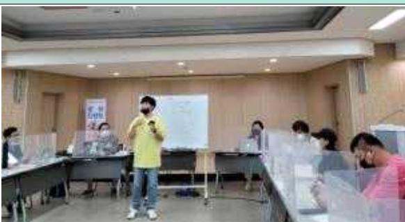
문화다양성 활동을 위한 라운드 테이블 현장 1