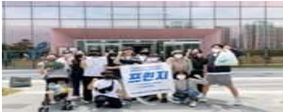
부대행사 체험 : 프린지 인천과 함께하는 플로깅