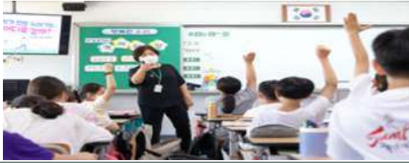
부대행사 교육 : 찾아가는 자원순환 교육