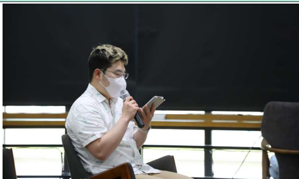
사진24. 시민토론자 사례 공유