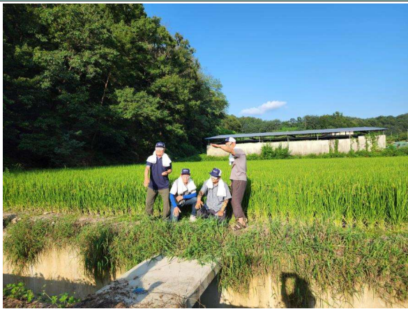
사진18. 콘텐츠 홍보물(웹포스터)