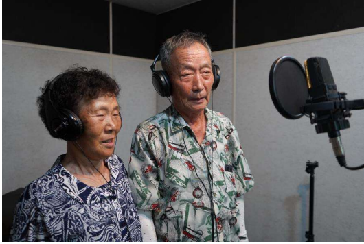
사진12. 경북, 하다 1