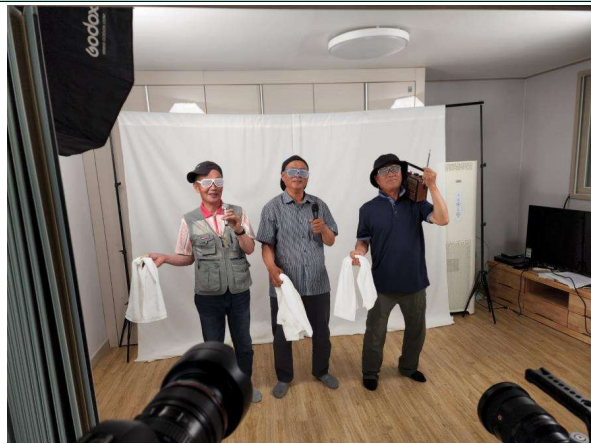
사진19. 콘텐츠 홍보물(카드뉴스) (1)