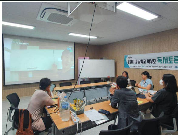
사진8. 연구모임 진행(3)