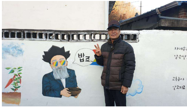
사진5. 경북, 하다(벽화활동)