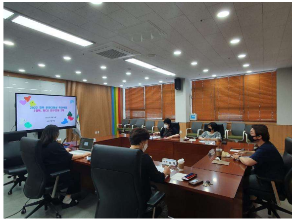
사진7. 연구모임 진행(2)