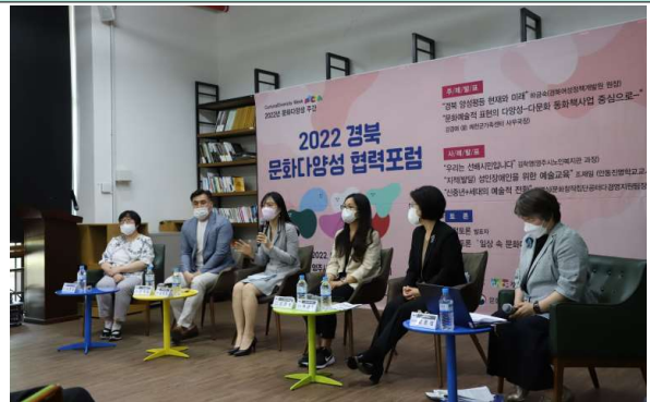
사진23. 전체 참여자 종합토론