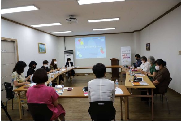
사진10. 세미나 진행(1)