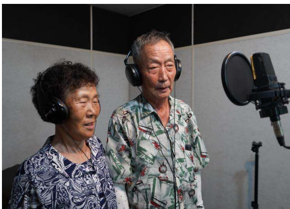
사진1. 경북, 하다(녹음)