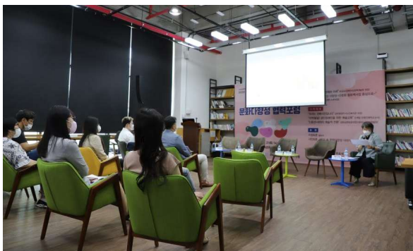
사진22. 경북문화다양성협력포럼 현장