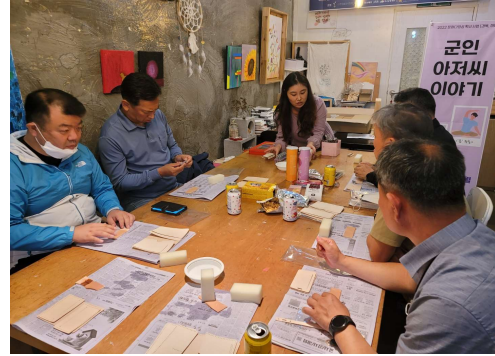
사진13. 경북, 하다 2