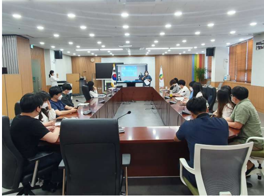
사진14. 경북, 하다 3