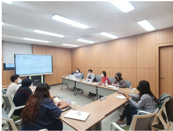
사진6. 연구모임 진행(1)