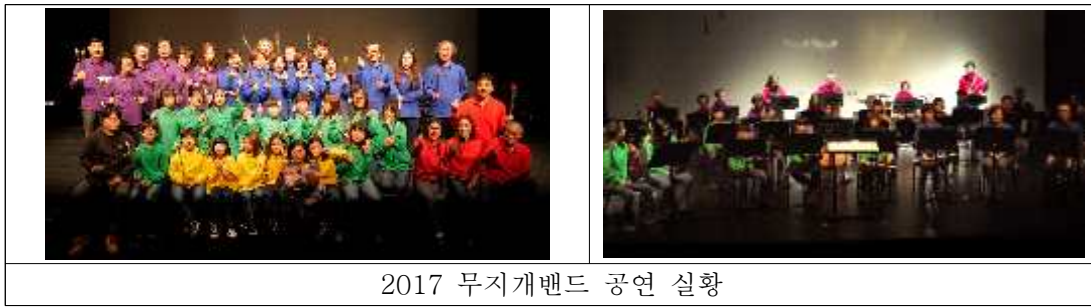
2017 무지개밴드 공연 실황