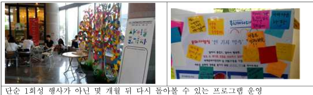
단순 1회성 행사가 아닌 몇 개월 뒤 다시 돌아볼 수 있는 프로그램 운영