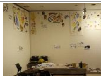
좌) 시민참여형 핑거프린트 작품과 우) 시민참여 예술작품 전시